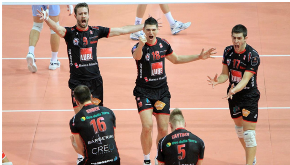
Использование формы игроков для рекламы в чемпионате Италии

Реклама на форме хорошо просматривается с трибун, на фото- и видеоматериалах. Реклама на игровой форме идеальный способ подчеркнуть статус Вашей организации и создать положительный имидж компании, как среди поклонников клуба, так и среди рядовых любителей спорта. Предлагаемые места размещения: на шортах, на майке спереди и сзади под игровым номером, на плечах