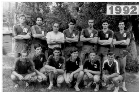
1 МЕСТО ПЕРВЕНСТВО СССР СРЕДИ КФК г. ПЕТРОПАВЛОВС

Клуб на регулярной основе является участником всех без исключения 27-ми чемпионатов России проводимых с 1992 года